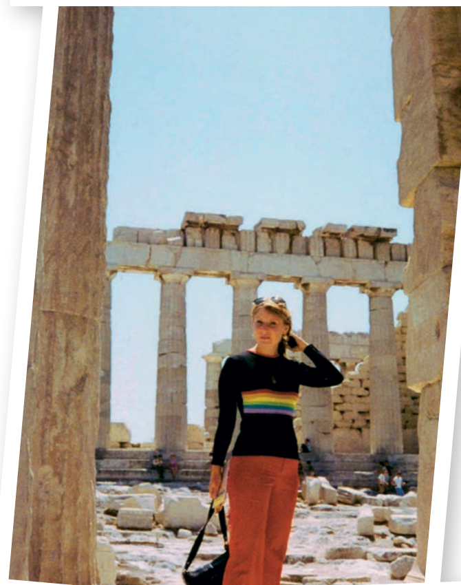
Wanda putuje cijeli život - uz ostalo je posjetila Grčku i razgledavala antičke hramove, u Meksiku je obilazila majanske piramide, a bila je i na otočju Sveti Stefan u Crnoj Gori